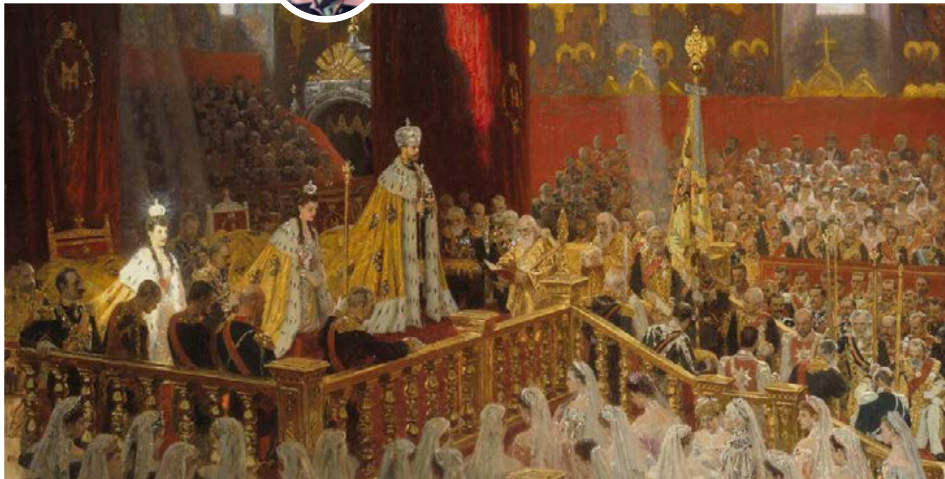
Coronación de Nicolás II y Alejandra Fiódorovna en 1896

N o imaginó heredar el trono de Rusia. Creció como un niño mimado, alejado de los vaivenes de la política, ignorante de los vericuetos que vivía su padre, el Zar Alejandro III. Este chico, que pasó su infancia entre servicios religiosos y desfiles, era el cuarto hijo de Alejandro y de María Fiodorovna. Cuando subió al poder como nuevo zar, optó por el nombre de Nicolás II.