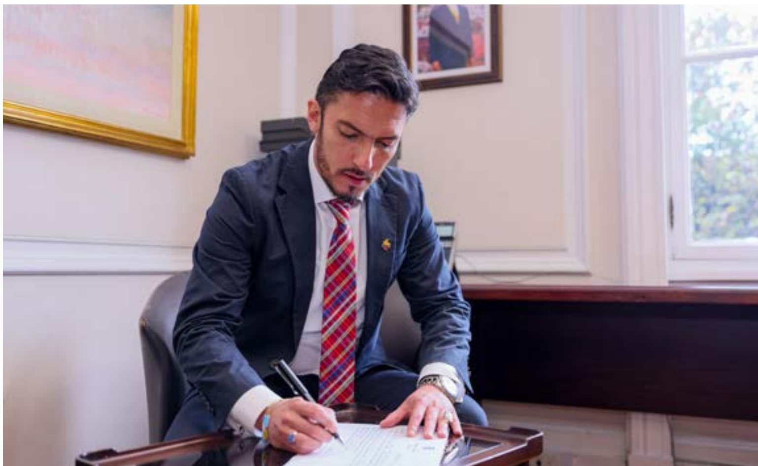
Juan Carlos Florián Silva, ministro de la Igualdad