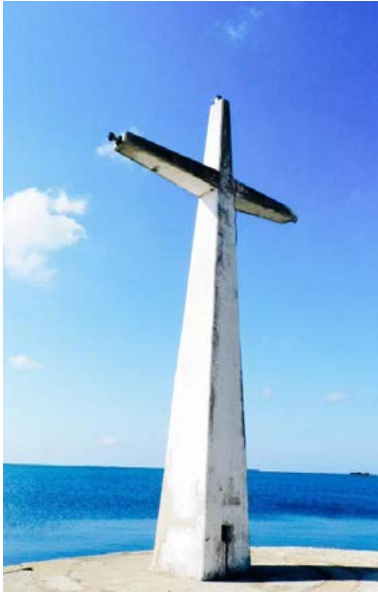
Santa Cruz del sur