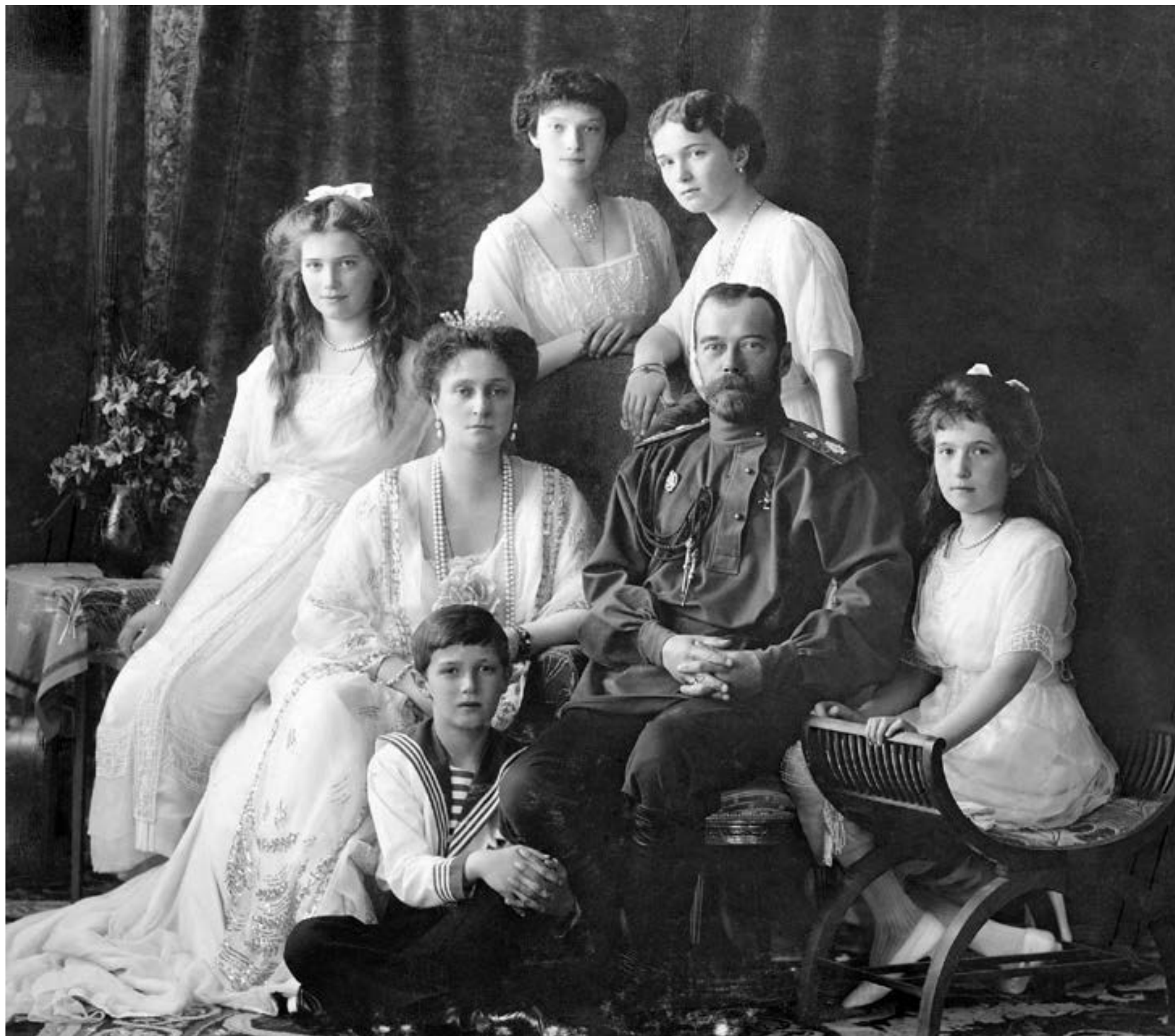
La familia imperial en 1913.

El romance de Nicolás y Alejandra se mantuvo intacto, como las porcelanas que se cuidan porque nadie puede reproducirlas igual. Sus sentimientos, profundos y sinceros, no cambiaron. La falta de un hijo varón -que llegaría en 1904-, las guerras, los funcionarios que la enfrentaron, las manifestaciones de 1905 realizadas por los rusos, nada ni nadie pudo tumbar esa relación apasionada y juvenil que