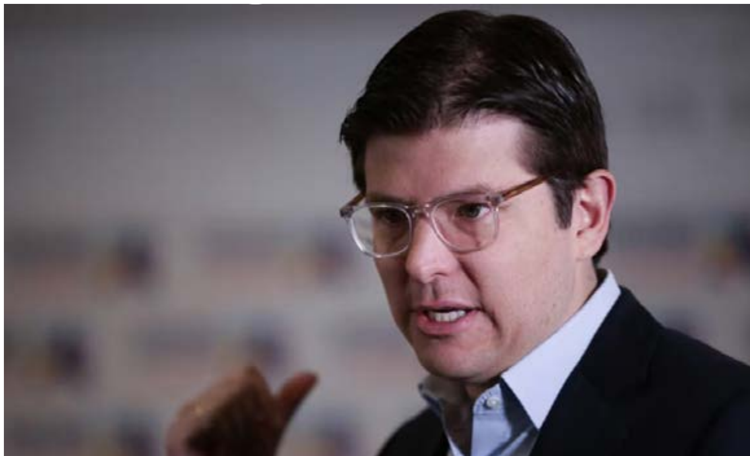
Miguel Uribe Turbay Q.E.P.D