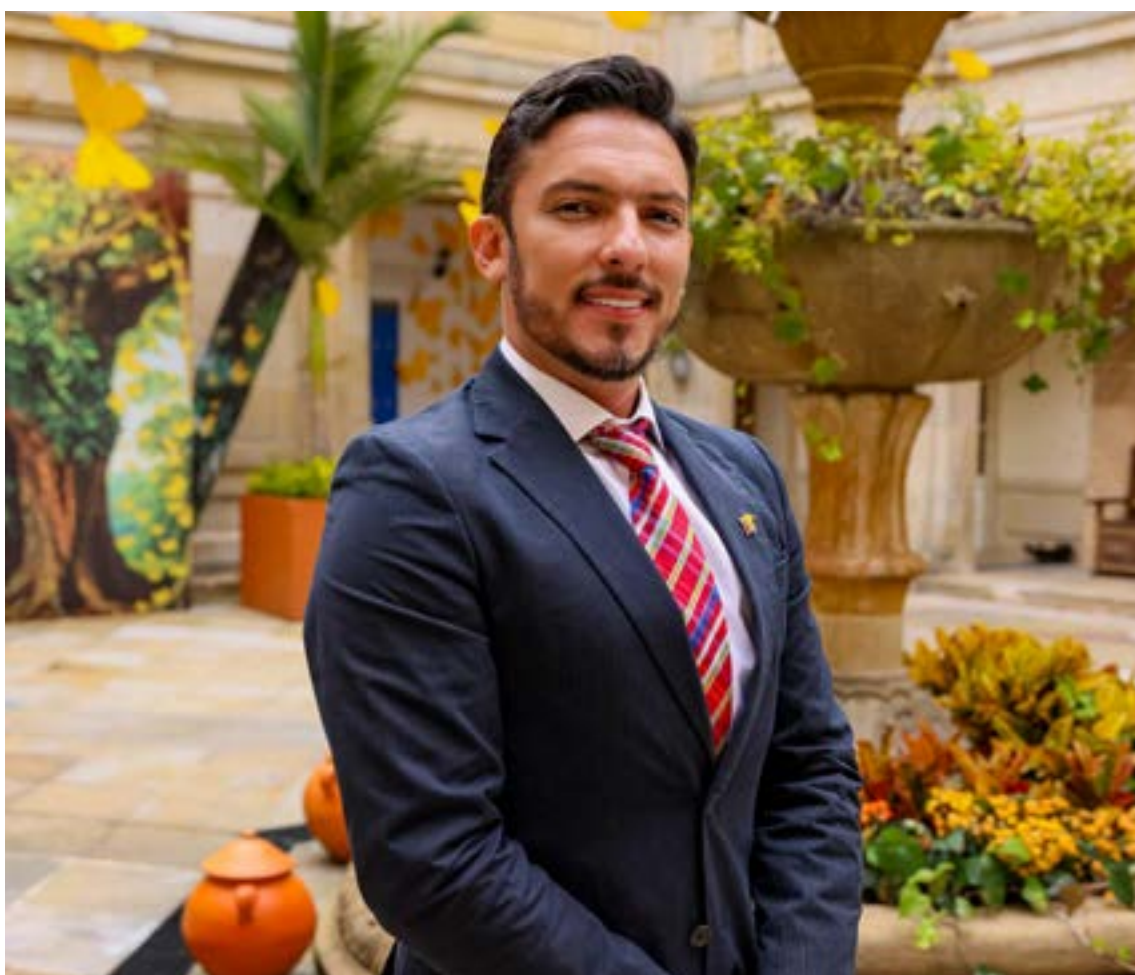
Durante el acto de posesión, Florián reafirmó su compromiso con la equidad, la diversidad y la justicia en el país.

Durante el acto de posesión, Florián reafirmó su compromiso con la equidad, la diversidad y la justicia en el país. «Con orgullo y compromiso asumo hoy como Ministro de Igualdad y Equidad, para seguir trabajando por las poblacio-