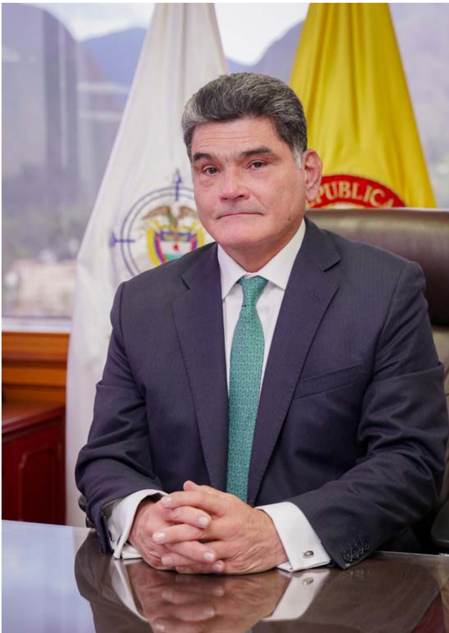
Gregorio Eljach Pacheco, Procurador General de la Nación

El Procurador expresó su confianza en la labor de la Fiscalía, pero también manifestó su preocupación por la lentitud del proceso. Aunque esperaba que la entidad lograra identificar a los responsables, solicitó una mayor celeridad en las investigaciones. «Esperemos que la Fiscalía en su eficiencia logre rápidamente determinar autores intelectuales y los autores materiales», afirmó, y agregó que «debería trabajar con más agilidad para que Colombia sepa qué pasó, dónde se originó y qué propósito tenía el asesinato de este joven».