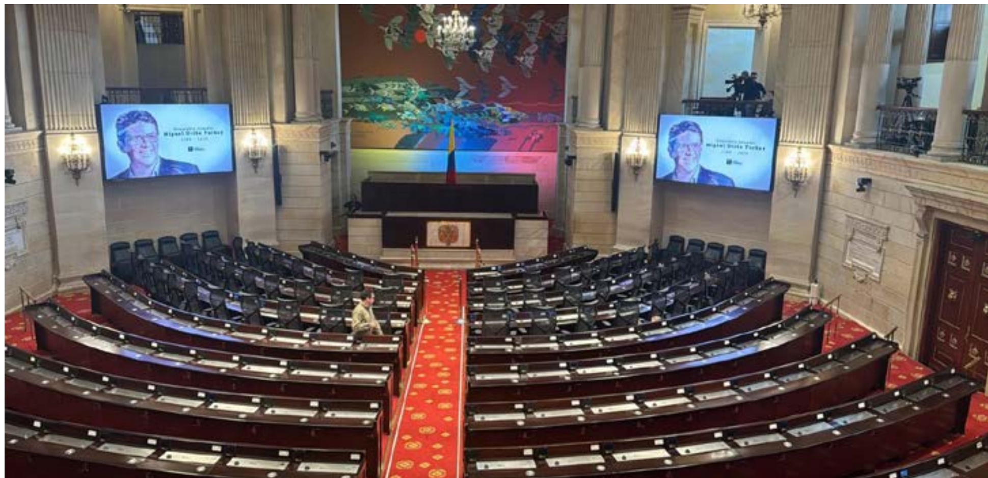
El cuerpo del senador Miguel Uribe Turbay será velado en una capilla ardiente en el Salón Elíptico del Congreso de la República.

muy diferente al que inicialmente y de manera prejuiciada, se insinuó. La investigación debe profundizarse. Y serán las autoridades competentes para ella, ayudada por expertos internacionales, quienes se pronunciarán en su momento.