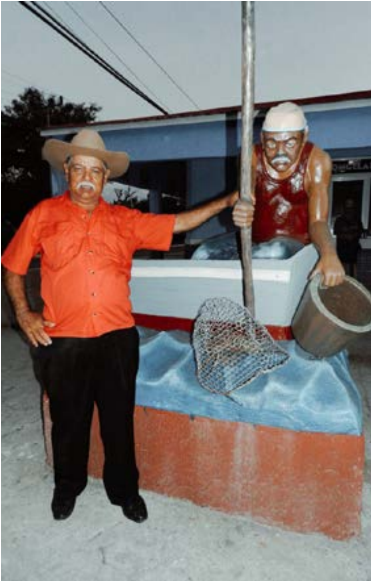
Gente que respiraron brisa y ya no están