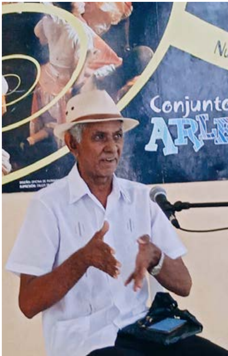
Regreso a escuchar historias

mar no es solo paisaje». Tal como recoge CUBALGIA en un video dedicado al lugar, el Caribe es «un espejo que guarda las risas y los silencios de quienes lo miran». Al terminar la licenciatura, impulsado por el deseo de plasmar un proyecto literario basado en mis vivencias en los Canarreos, me alejé nuevamente por casi siete años. Sin embargo, cada año regresaba al enclave de arenas mulatas de Playa Bonita para percibir el aroma salino, buscar los ecos de mi infancia y reencontrarme con «el sonido de las olas rompiendo contra el maldcón».