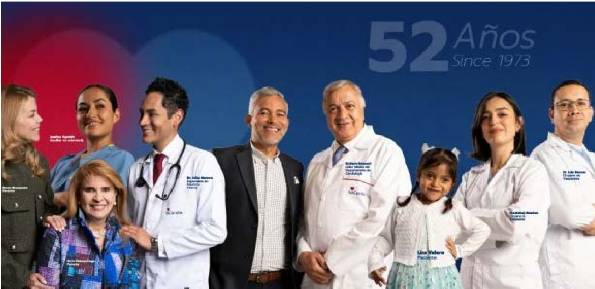
La Fundación Cardioinfantil – LaCardio conmemora 52 años de trayectoria