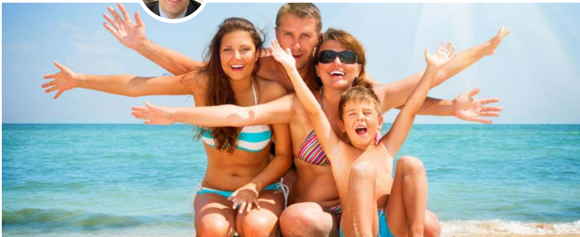
Vacaciones en familia

A lo largo de mi vida siempre me he preguntado si realmente somos conscientes de la importancia de tomar vacaciones. Para muchas personas, este tiempo se limita a coincidir con el receso escolar de sus hijos o con celebraciones familiares, como la Navidad. Pero, en una sociedad tan vertiginosa y demandante como la actual, detenernos se vuelve una necesidad más que un lujo.